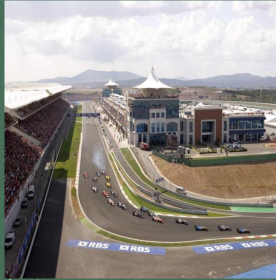
فورمولا 1 مركز تسويق اسطنبول بارك