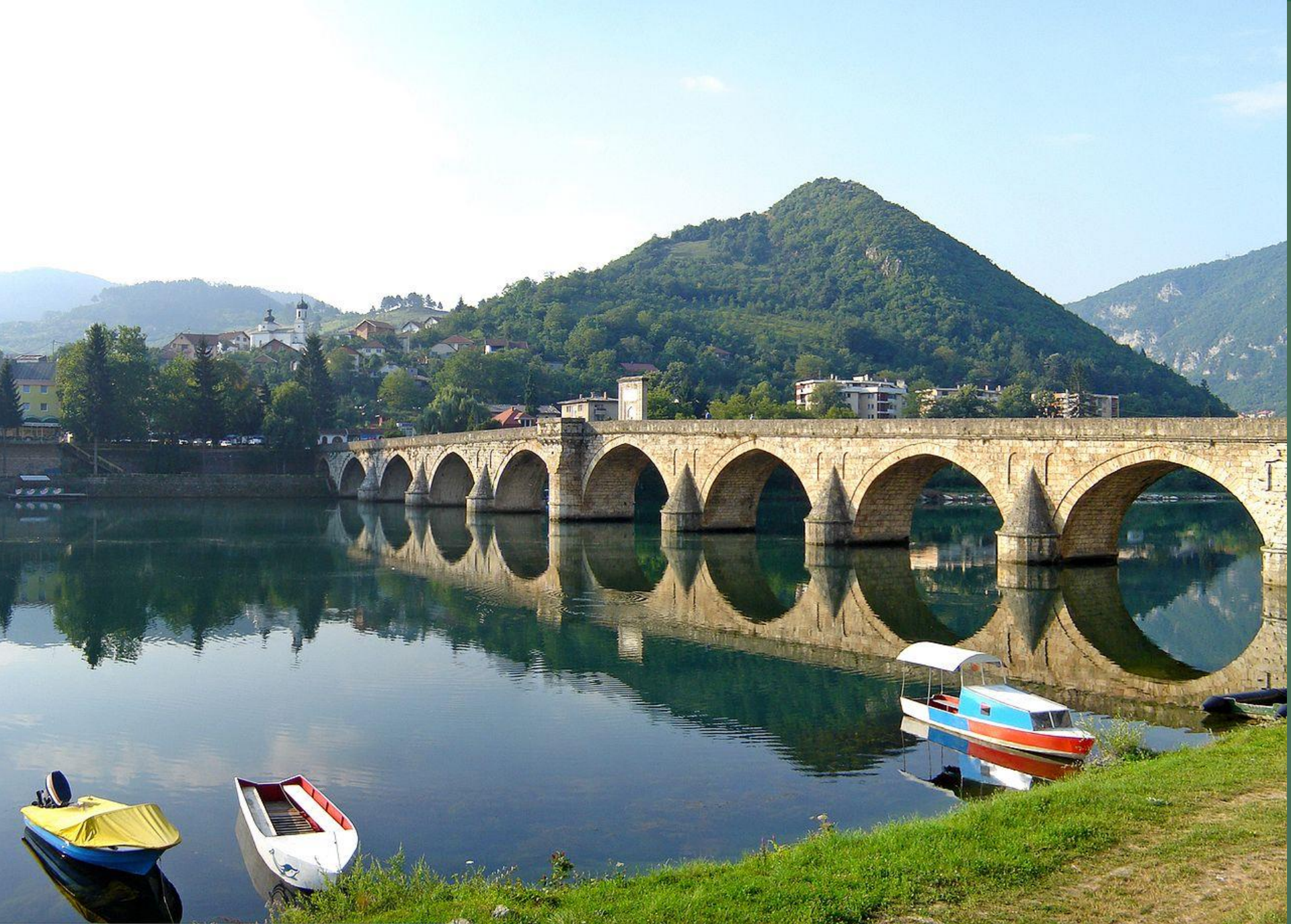
جسر فيسيغراد درينا في البوسنة والهرسك (صوكوللو محمد باشا).