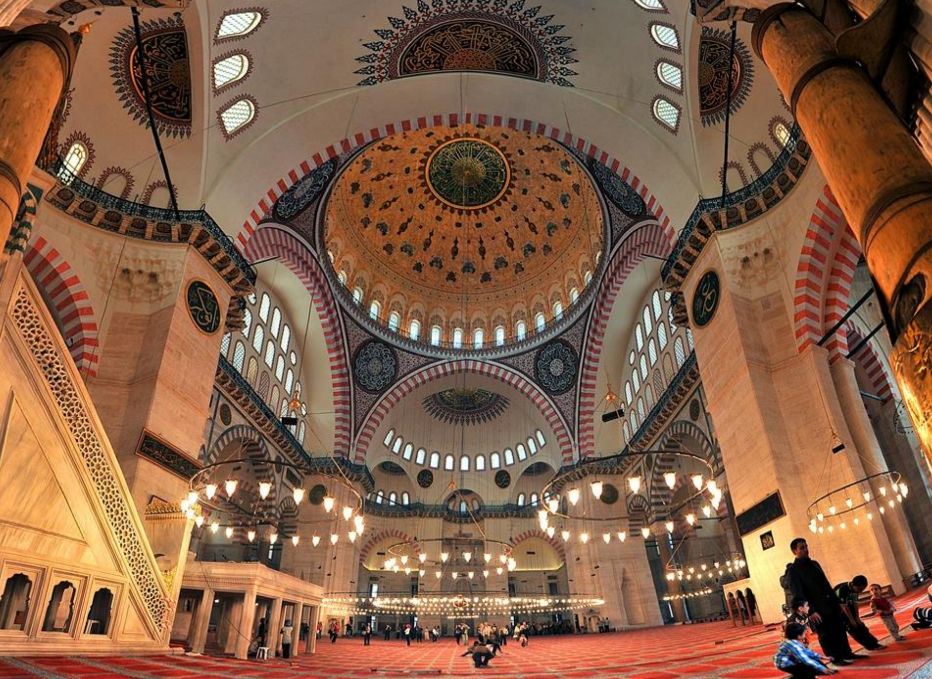
وقف جامع السلیمانیة فی اسطنبول فی القرن 16