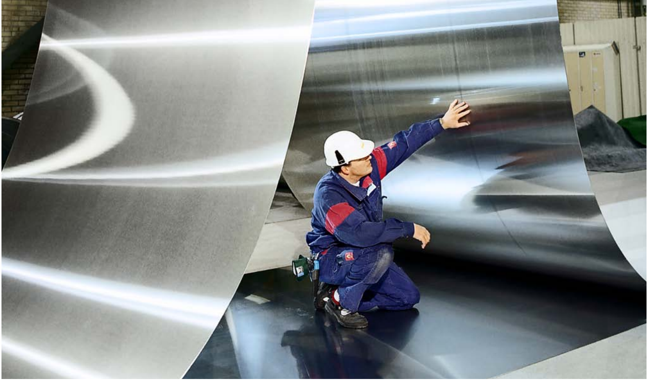
يعمل موظف من شركة إس كي إف (SKF) على فحص الألواح المعدنية. ولقد حصدت الشركة تصنيفاً عالياً في "النشرة السنوية للإستدامة 2010".