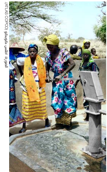
مشروع "أطلس كوبكو" - الماء للجميع (Water for All).

إن شهادة الأيزو 14001 (ISO 14001) هي شهادة لأنظمة الإدارة البيئية وهي كثيرة الاستعمال في الأعمال التجارية السويدية، ويوجد أكثر من 3,800 شركة مصدقة في عام 2010. وفي بعض القطاعات، مثل الطباعة، ترؤد الشهادة ميزة تنافسية قوية. وتظهر الإحصائيات من معهد المعايير السويدي بأن السويد تسجل أحد أعلى النسب في العالم فيما يتعلق بالشركات المصدقة بيئياً مقابل التعداد السكاني.