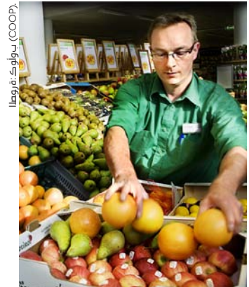
أطلق على «كأوب» في عام 2011 أكثر علامة تجارية مستدامة في السويد.

Electrolux»، و«ساندفيك (Sandvik)»، و«إس كي إف (SKF)»، و«إس سي آي (SCA)»، و«سويدبانك (Swedbank)»، و«تيلياسونيرا (TeliaSonera)»، و«فولفو (Volvo)». ويزود «الكتاب السنوي للاستدامة لعام 2010» الأسس لمؤشرات داو جونز للاستدامة. وقد أدرجت ثلاث شركات سويدية كرواد يحملون تصنيفاً ذهبياً أو فضياً وهي: «إليكترولوكس (Electrolux)» ضمن الفئة الذهبية، و«إس كي إف (SKF)» و«إس سي أي (SCA)» ضمن الفئة الفضية. • تصنف أعمال الاستثمار العام المصرفية وشركة السندات المالية «غولدمان ساكس (Goldman Sachs)» وشركة الخدمات المالية «يو بي إس (UBS)» الشركات السويدية تصنيفاً عالياً عندما يتعلق الأمر بعمليات الاستدامة. ويعتبر فريق أبحاث الاستدامة في «غولدمان ساكس» شركتي «آي بي بي (ABB)» و«أطلس كوبكو (Atlas Copco)» المفضلتين لديه عالمياً، إلا أن «فولفو (Volvo)» و«إس كي إف (SKF)» أيضاً من بين أفضل عشر شركات في القطاع الصناعي. ويوضح المصرف بأن ريادة الشركات السويدية تعود وبشكل كبير إلى شفافيتها ومعلوماتها العامة المكثفة بخصوص القضايا البيئية والاجتماعية. أما شركة «يو بي إس (UBS)» فهي أيضاً يهبرها قطاع الصناعة السويدي وتوصي بـ«أسا أبلوي (Assa Abloy)»، و«أطلس كوبكو (Atlas Copco)»، و«ساندفيك (Sandvik)»، و«إس كي إف (SKF)» كشرركات مفضلة لديها في مجال الاستدامة. ■