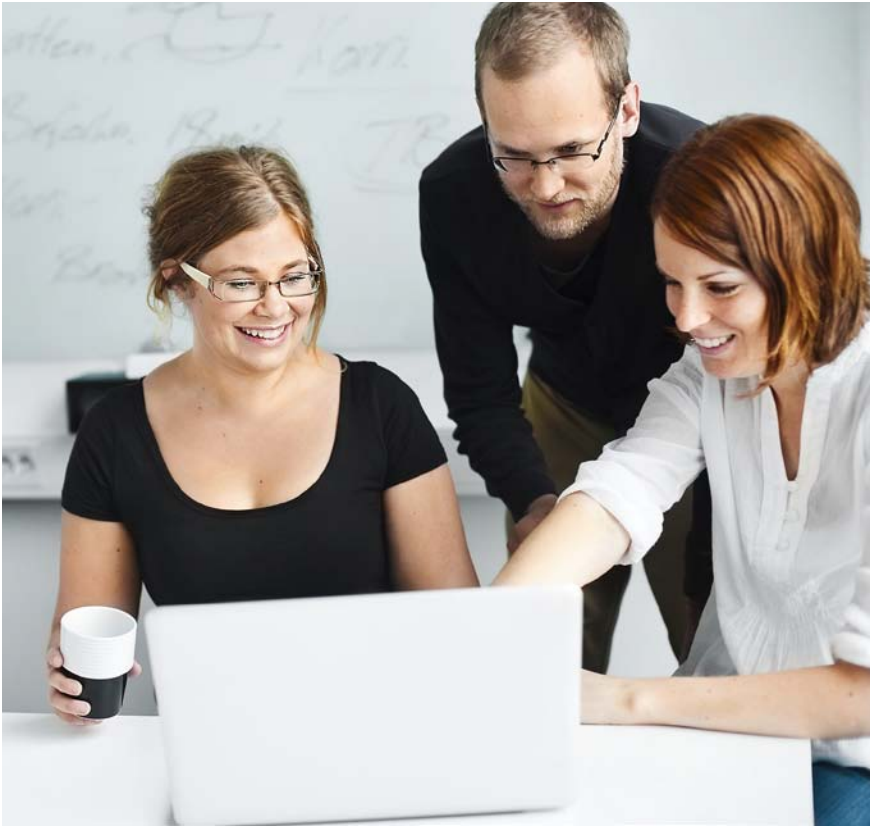
إن المساواة في موقع العمل هو وسيلة للشركات للعمل بمفهوم «المسؤولية الاجتماعية للشركات».

للنهج الذي تتبعه الشركات في مسؤولياتها. ومن الأمثلة على ذلك، تمكين الآباء من الجمع بين العمل والعائلة، وتشجيع المشاركة المتبادلة لرعاية الطفولة، وإعطاء الرجال والنساء فرصاً متكافئة ومتساوية للارتقاء إلى المواقع القيادية.